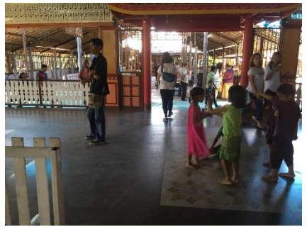
การแสดงจากนักเรียน โรงเรียนราษฎร์นรินทร์