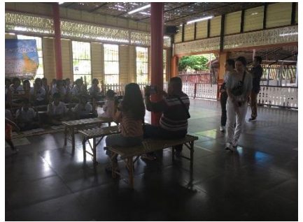
การแสดงจากนักเรียน โรงเรียนวัดบ้านหว้า