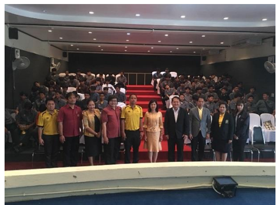
วิทยาลัยเทคนิคหนองบุรี