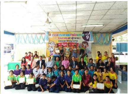
เยาวชน ฝึกเรียนเข้าร่วมประกวดวาดภาพระบายสีตามจินตนาการ