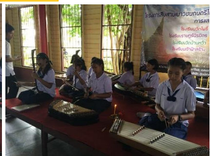
การแสดงจากนักเรียน โรงเรียนเจ้าฟ้าสร้าง