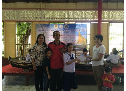
การแสดงจากนักเรียน โรงเรียนวัดโพธิ์