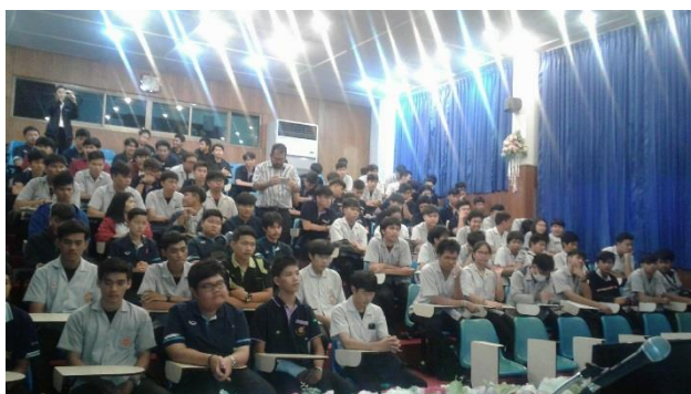
วิทยาลัยเทคนิคลพบุรี