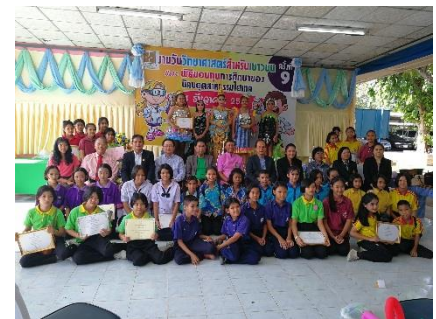
เยาวชน ฝึกเรียนเข้าร่วมประกวดชุดแต่งกายจากวัสดุเหลือใช้