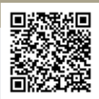
รายละเอียดหลักสูตร