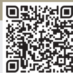
ดาวน์โหลดใบสมัคร